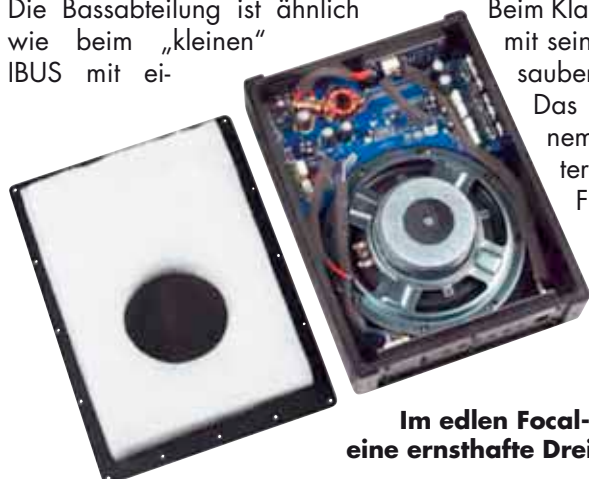
Im edlen Focal-Gehäuse befindet sich eine ernsthafte Dreikanalendstufe

Beim Klang kann sich der Focal sowohl mit seiner Power als auch mit seinem sauberen Spiel bestens profilieren. Das ist erstklassiger Bass aus kleinem Gehäusevolumen. Mit unter 55 Hz Tiefgang punktet der Franzose auch bei Hörern, die einen ernsthaft tiefen Bass nachrüsten wollen. Auch angesichts des hohen Preises kann man nur sagen, dass die Leistung stimmt.