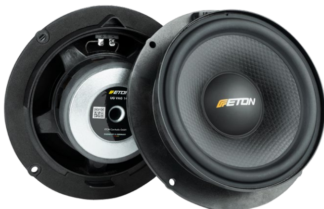
UG VAG 14